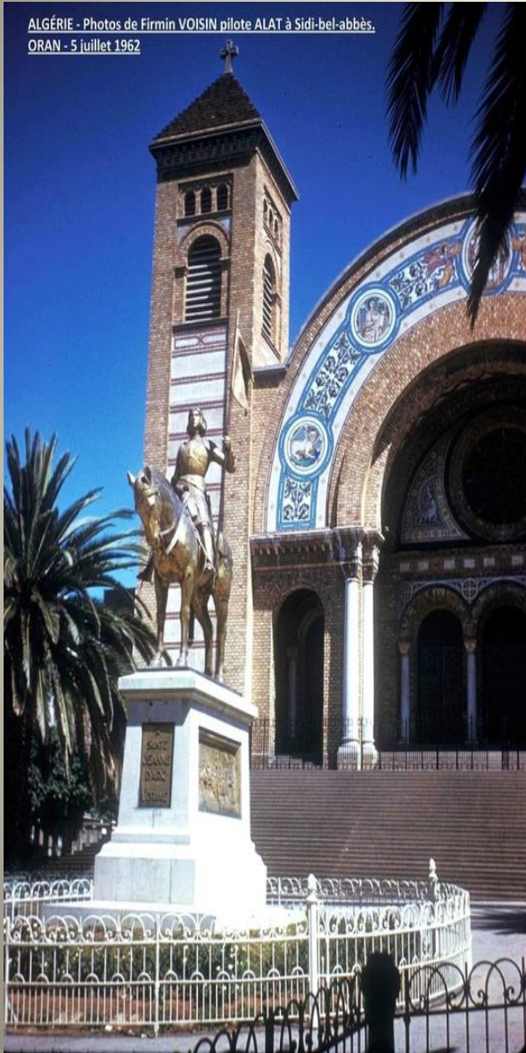
ALGÉRIE - Photos de Firmin VOISIN pilote ALAT à Sidi-bel-abbès. ORAN - 5 juillet 1962